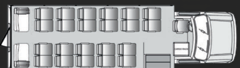
26 passagers plus le chauffeur avec compartiment à bagages arrière sécuritaire