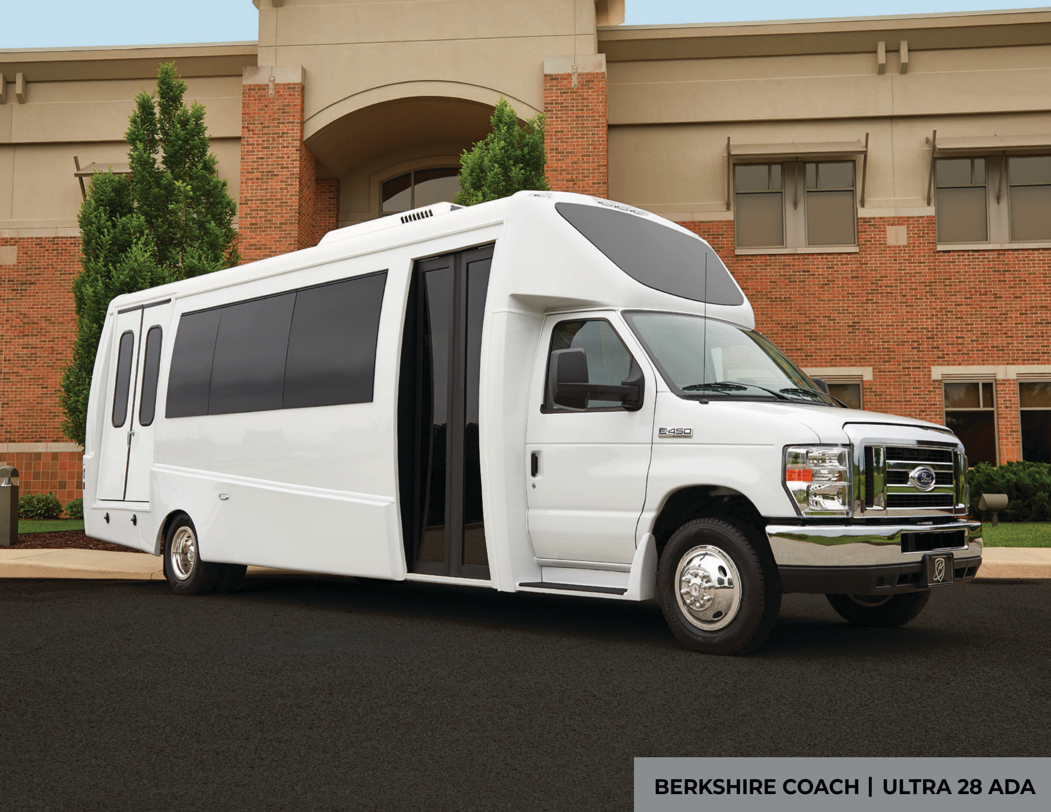
BERKSHIRE COACH | ULTRA 28 ADA