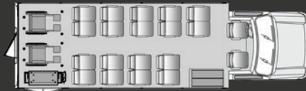
18 passagers plus le chauffeur/copilote plus deux fauteuils roulants