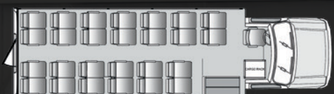
26 passagers plus le chauffeur