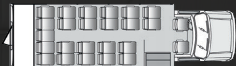
23 passagers plus le chauffeur/copilote et bagages arrière

Conçu et fabriqué sur mesure dans notre usine d'Elkhart, en Indiana, chaque autocar ULTRA 28 incarne le luxe intelligent. Notre style extérieur est à la fois avant gardiste et intemporel. De notre profil exclusif qui se démarque par son élégance à notre fenêtre panoramique, vous reconnaîtrez en tout le luxe intelligent qui caractérise Berkshire Coach.