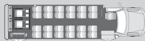
24 passagers, 2 fauteuils roulants, 4 sièges rabattables plus le chauffeur