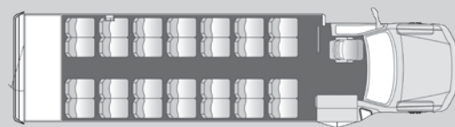
28 passagers, bagages arrière plus le chauffeur