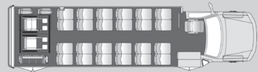
24 passagers plus 2 fauteuils roulants 4 sièges escamotables plus le chauffeur